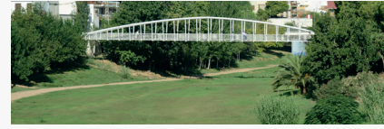
Barranc de Xiva i Passarella