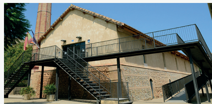
Museu de la Rajoleria