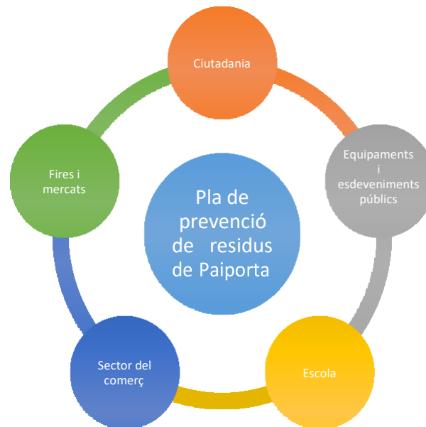
Gràfic 2: Àmbits d'actuació del Pla local de prevenció de Paiporta (elaboració pròpia)

Pel que fa als àmbits del la, aquests se corresponen amb els àmbits de generació: